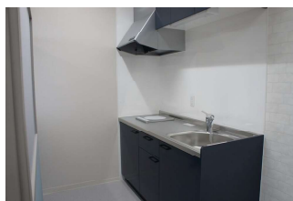
共有スペースキッチン